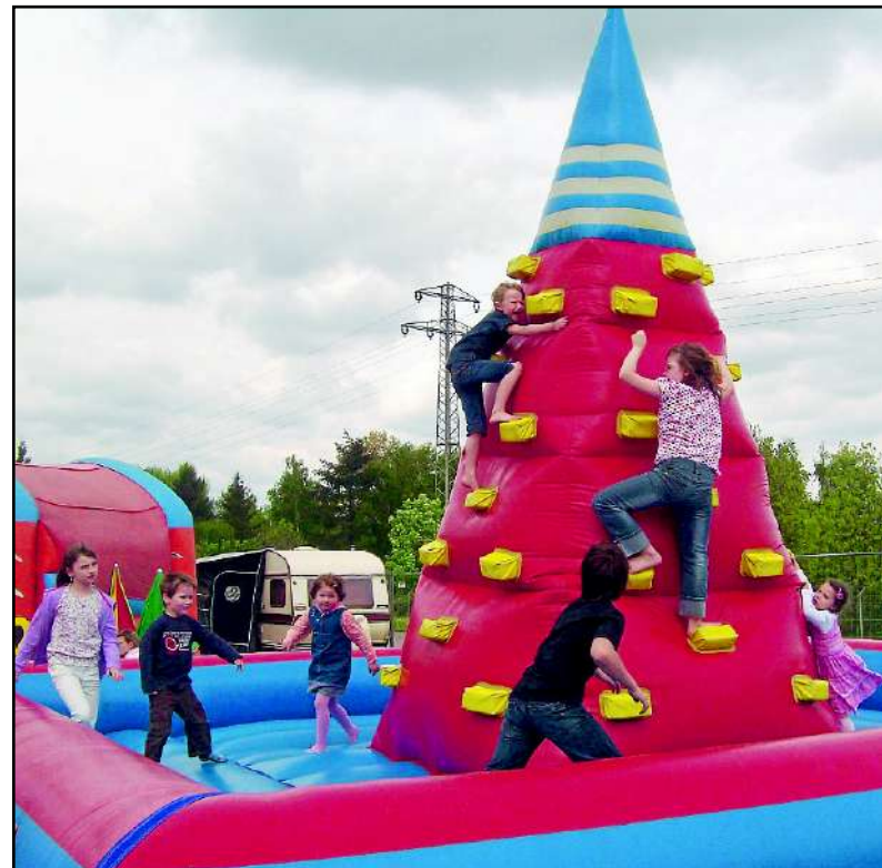
Der aufblasbare Kletterturm ist eine der vielen Attraktionen in der Abenteuerstadt.

Der General-Anzeiger verlost fünf mal zwei Eintrittskarten: Rufen Sie uns an unter